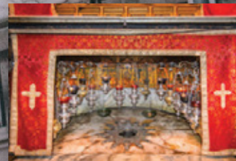
Iglesia de Natividad